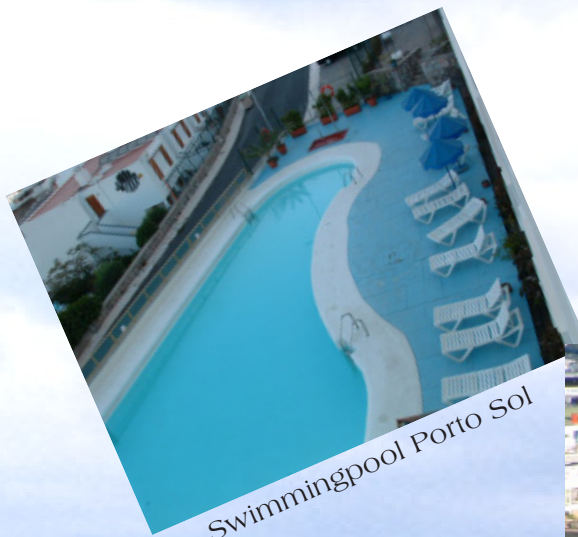
Swimmingpool Porto Sol