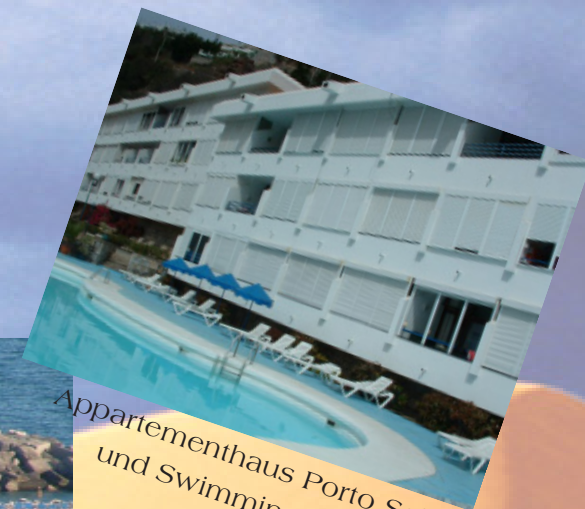
Appartementhaus Porto Sol und Swimmingpool